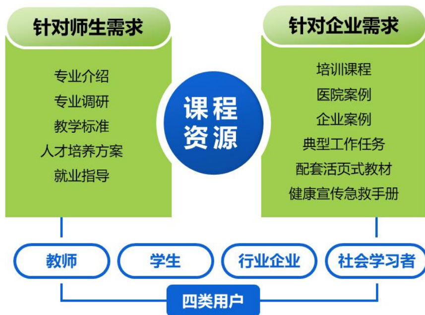
数字化教学资源库建设应用路径图